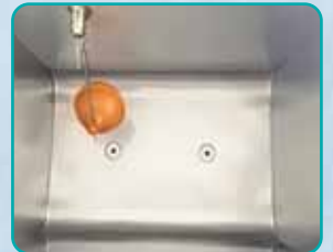
Stitched Chrome Boiler.