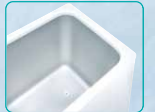
304 Stainless Steel Monoblock Inner Water Chamber