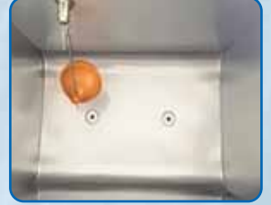
Stitched Chrome Bailer.