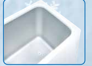
304 Stainless Steel Monoblock Inner Water Chamber